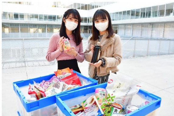
JWU PR アンバサダーも食品の回収と配布に協力