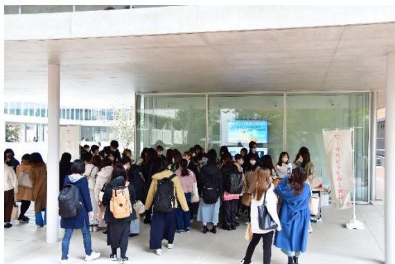
百二十年館ピロティで集まった食品を配布

本活動には、学生組織である「JWU PR アンバサダー※2」も告知や運営に協力し、家庭で余っている食品を回収後、11月28日（月）からの1週間で、回収した食品と賞味期限の近づいた本学の防災備蓄品の配布を行いました。