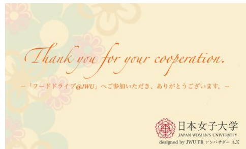
裏面にアンケートの QR コードが付いた サンキューカード