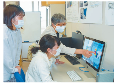
実験・実習を重視し、充実した実験施設で少人数によるきめこまやかな指導が行われています。